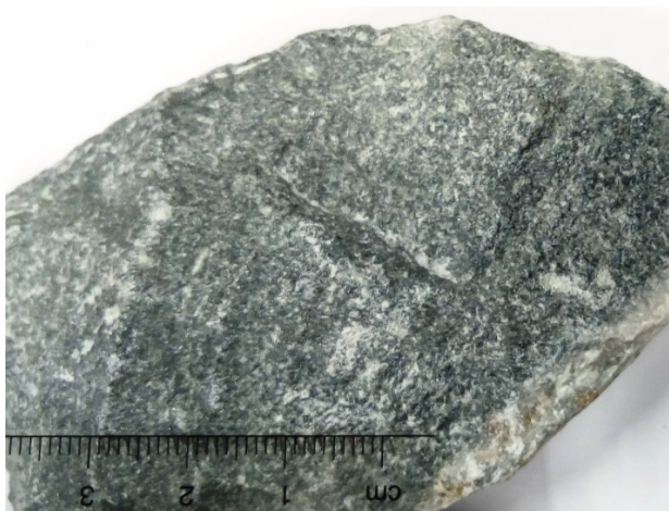
Figuur 1: Bestone ®