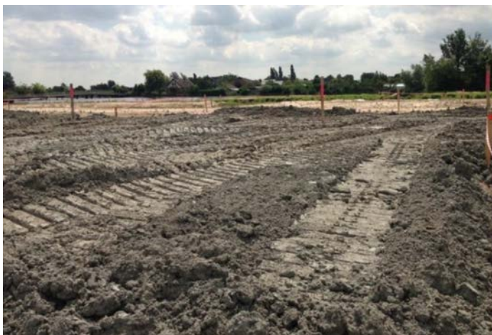
Figuur 5: Granuliet toegepast in een terreinophoging in Roelofarendsveen 2

Bij de verwerking van gesteenten komt fijn materiaal vrij. Hiervoor wordt eveneens de benaming 'granuliet' gebruikt. Onderstaande slaat op het fijne materiaal dat vrijkomt bij verwerking van gesteente. Figuur 5 laat een toepassing zien van granuliet 1 in een terreinophoging.