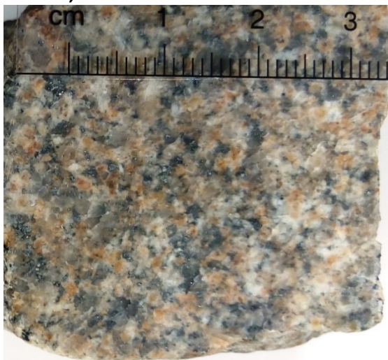
Figuur 3: Graniet (Glensanda)